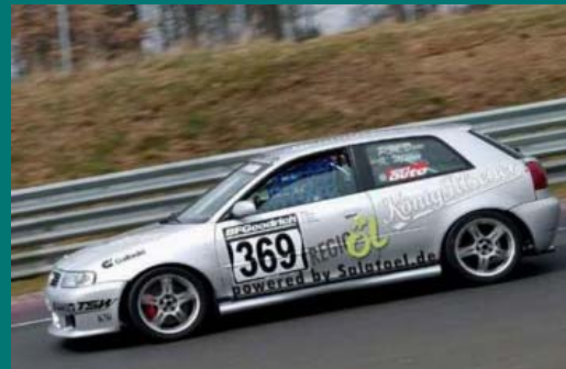
Tour-racecars : Test- fahrten mit PPO