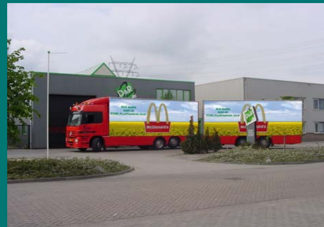
Mc. Donalds LKW-Flotte