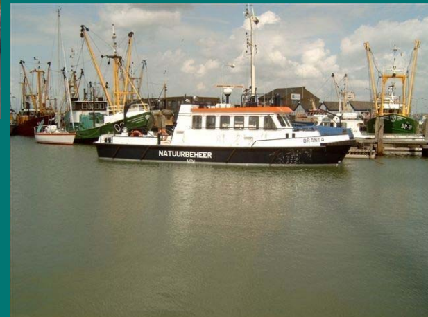
Zeeland- Küstenschiff Umweltinspektions Fahrzeug