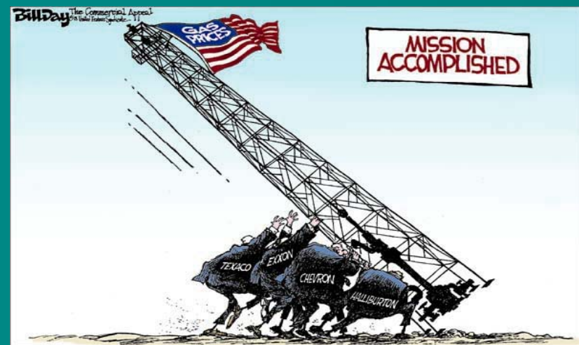
Vorbei! In 30 Jahre ??